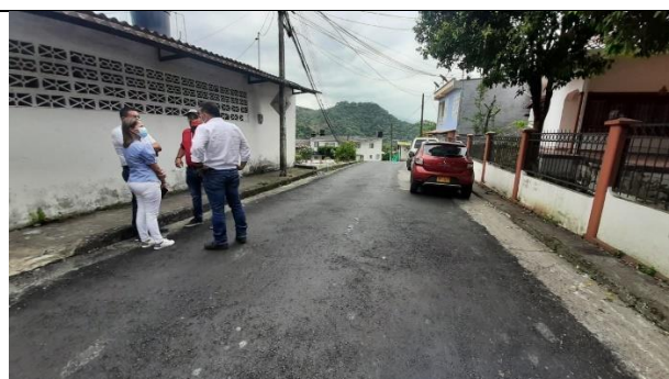
Ilustración 6: Visita técnica contrato 1006 de 2020.