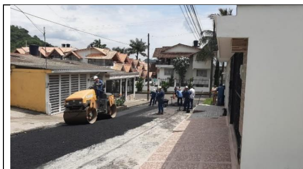
Ilustración 5: Visita técnica contrato 1006 de 2020.