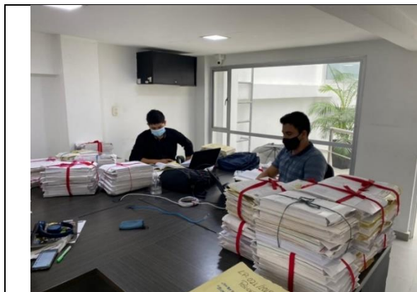
Ilustración 1: Análisis documental