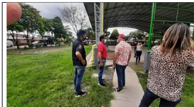
Ilustración 3: Visita técnica (Mindeporte, contratista, interventoría y supervisión.)