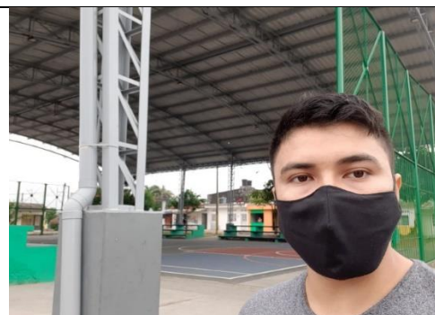
Ilustración 4: Visita técnica contrato 2042 de 2018.