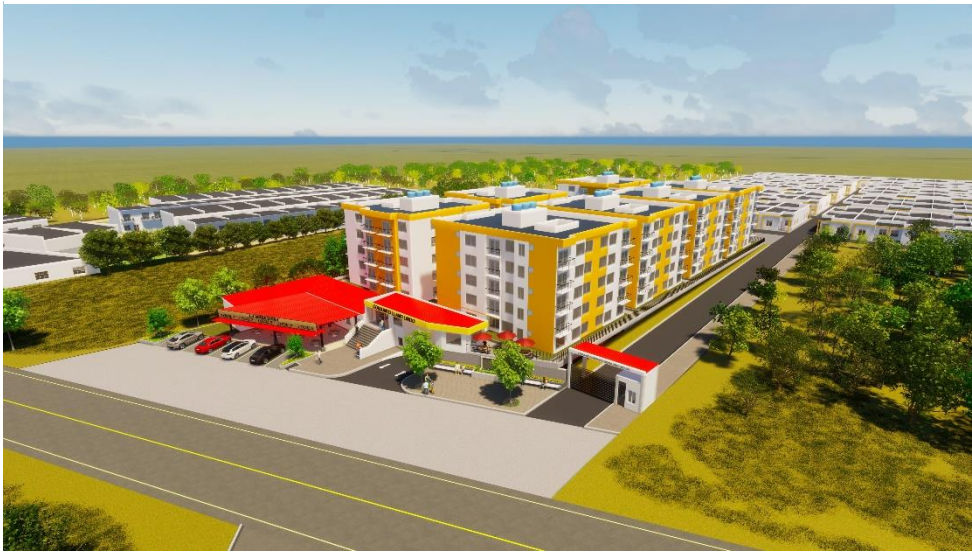
Nota: Conjunto residencial llano lindo