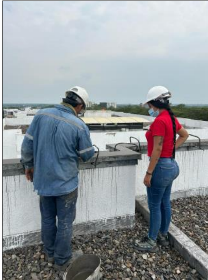
Ilustración 8. Actividades realizadas.

Se realizó supervisión de actividad de instalación de formaletas para el vaciado de alfajías, instalándolas en los bordes de los muros dándole función para la protección de los mismo, colocándoles unos bocales para darles la forma de gotero, realizándolas en las 9 torres del Conjunto Hacienda Rosa Blanca-Canaguay (Amarilo).