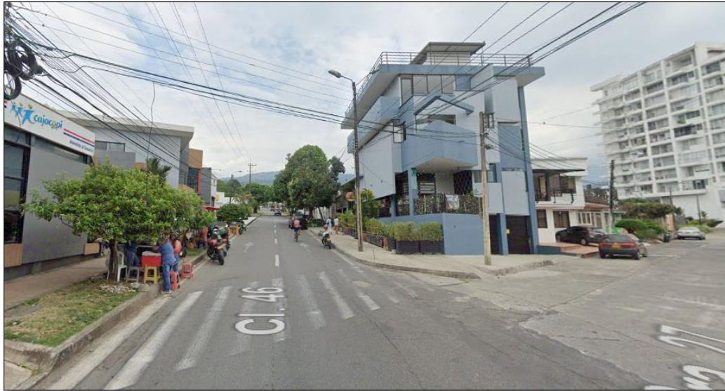
Ilustración 1. Ubicación geográfica de la empresa CONSTRUWAPA S.A.S, Google maps imagen (2023)