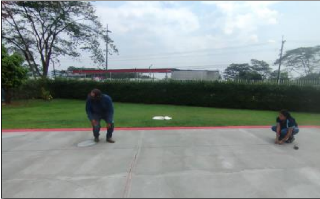
Ilustración 9. Actividades realizadas. Fuente propia, 2024.

Se hizo una visita en el conjunto Saint Thomas (Acacias) junto con el tutor de la empresa realizando actividad del mantenimiento correctivo de la demarcación de la cancha, con ayuda de los trabajadores encargados de dicha actividad.