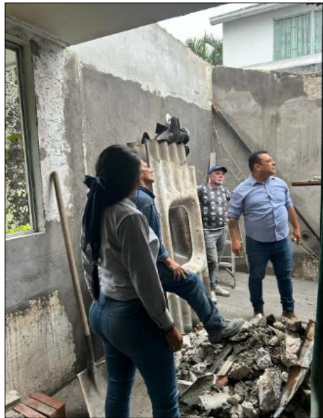
Ilustración 12. Actividades realizadas.

Se realizó visita a la obra con el dueño de la casa y personal encargado de actividades de la remodelación de cocina y se dejaron claras las inquietudes que tenía el cliente.