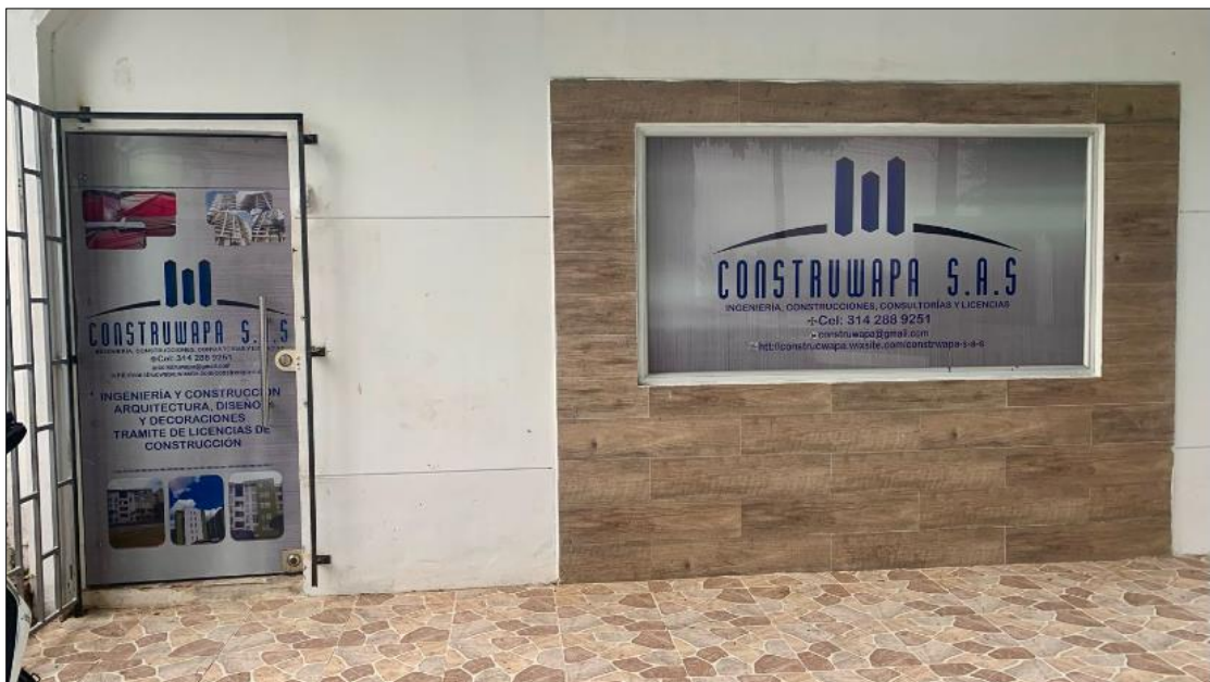
Ilustración 2. Ubicación oficina física COSNTRUWAPA S.A.S.