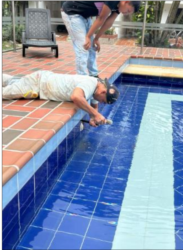
Ilustración 14. Actividades realizadas.

Se hizo visita de obra del mantenimiento de sistema de purificación piscina en conjunto en el conjunto Casivare, realizando el retiro de algunas tabletas para hacer revisión de tubos si hay filtraciones ya que vaso de la piscina no estaba haciendo su función como debía de ser, entonces fuimos con un plomero para que hiciera la revisión correspondiente hiciera el arreglo requerido.