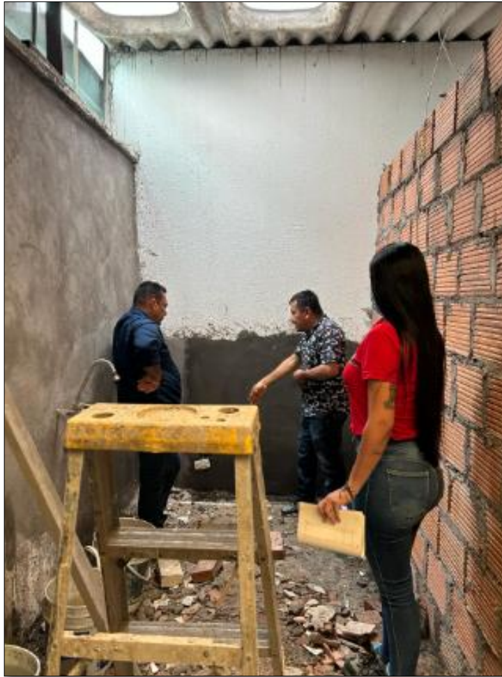
Ilustración 7. Actividades realizadas.

Se realizó visita a la obra con acompañamiento de nuestro tutor de prácticas junto el dueño de la casa donde se está realizando la remodelación de la cocina y se dejaron claras las inquietudes que tenía el cliente donde se le explica como quedaría distribuido los espacios de la cocina y patio de ropas.