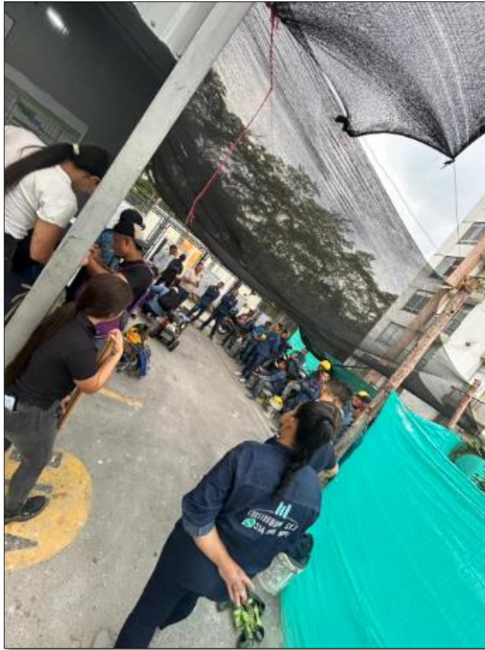
Ilustración 4. Actividades realizadas con el personal.

Se inicia con ronda en la obra junto con el tutor para la supervisión de actividades en el Conjunto Hacienda Rosa Blanca – Canaguay Amarillo; Mostrándonos y explicándonos que actividades tenemos que estar supervisándoles a los trabajadores, para cuando llegue la hora de la entrega del proyecto todas las actividades requeridas estén terminadas al 100%.