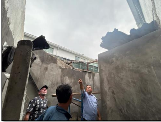
Ilustración 11. Actividades realizadas. Fuente propia, 2024.