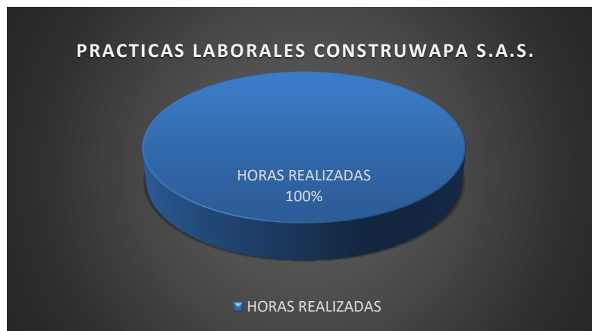
Ilustración 16. Tabulación de porcentaje de prácticas hechas.