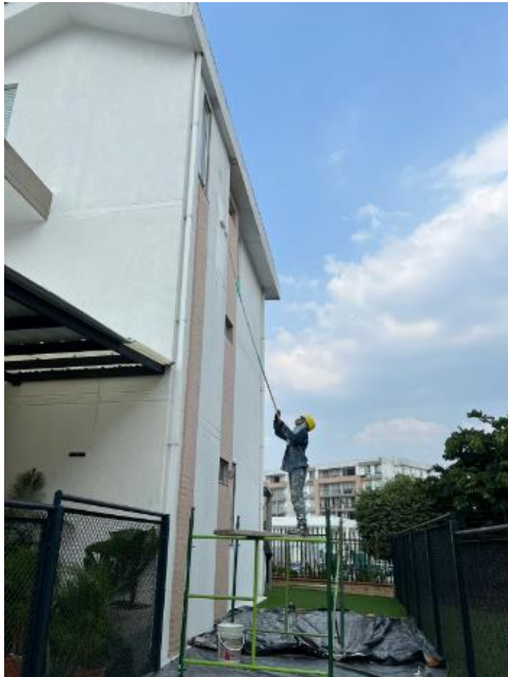
Ilustración 10. Actividades realizadas.

Se realiza supervisión de aplicación de sellador imprimante acrílico base agua de alta penetración en las casas y torres del Conjunto Hacienda Rosa Blanca – Canaguay (Amarilo).