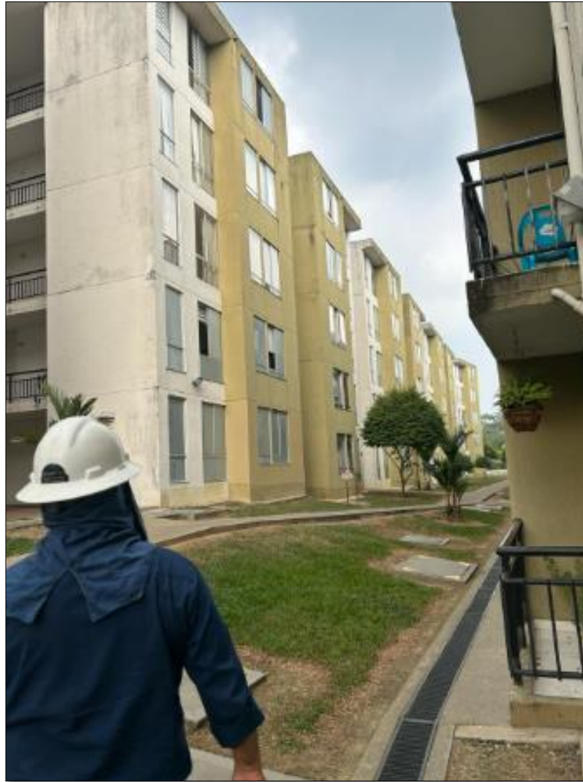
Ilustración 13. Actividades realizadas.

Se realizó visita conjunta Alborada con el supervisor de prácticas, haciendo toma de medidas y registro fotográfico para luego proceder a elaborar informe de consultoría de mantenimiento preventivo y correctivo de las fachadas y cubiertas.