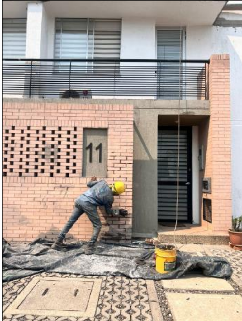
Ilustración 5. Actividades realizadas.

Se realizó ronda de supervisión de actividades de los diferentes trabajos que se tienen que desarrollar en el cronograma establecido por parte del contrato.