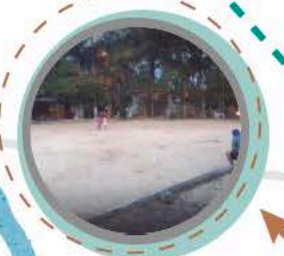
● Cancha de arena La Nohora.

- Las actividades principales de comercio del barrio La Nohora se encuentran sobre la avenida principal, vía que conecta el Municipio de Villavicencio con el Municipio de Acacías. - Las actividades de encuentro y esparcimiento se realizan en el parque La Nohora y en el salón comunal. - La vía principal del barrio se encuentra en un estado regular y las vías alternas e internas en mal estado.