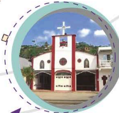
● Parroquia San Felipe Apostol: La Nohora, sector 3 casa 37.