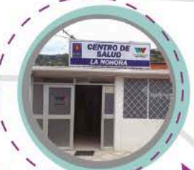
● Centro de salud La Nohora.