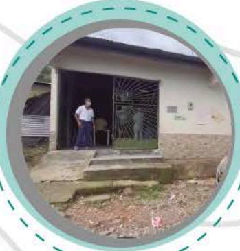
● Salón comunal: Ubicado en el sector 1 del barrio, lugar donde se reúnen a hacer actividades o reuniones.