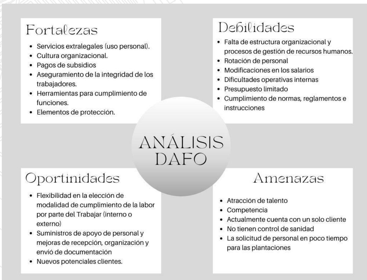
Ilustración 1. Estructura del diagnostico DOFA

Para realizar la estructura del diagnóstico se realizo por medio de la matriz DOFA (Debilidades, Oportunidades, Fortalezas y Amenazas).