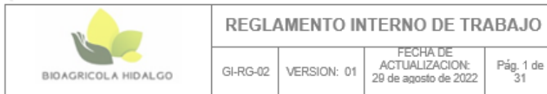
Ilustración 3. Reglamento interno del trabajo