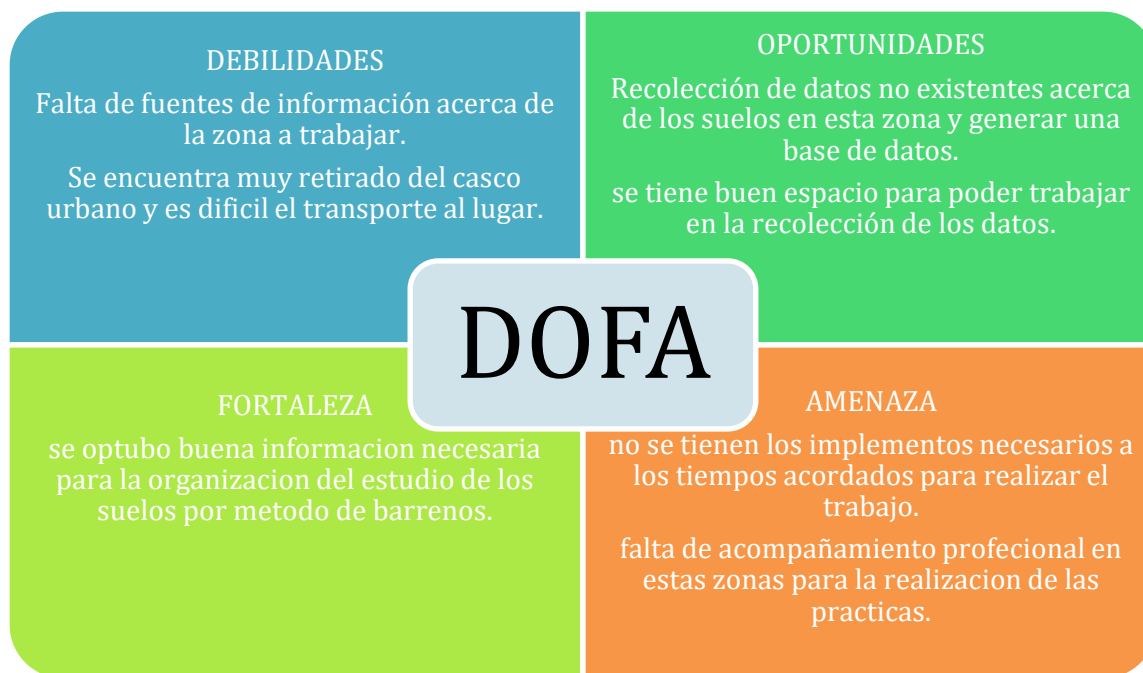
Tabla 2: matriz DOFA.