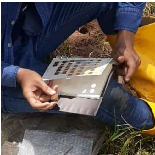
Ilustración 4 determinación de color del suelo.