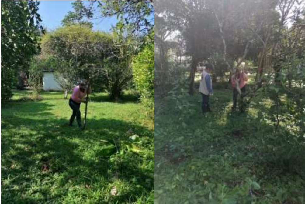
Ilustración 7 plantas hospederas