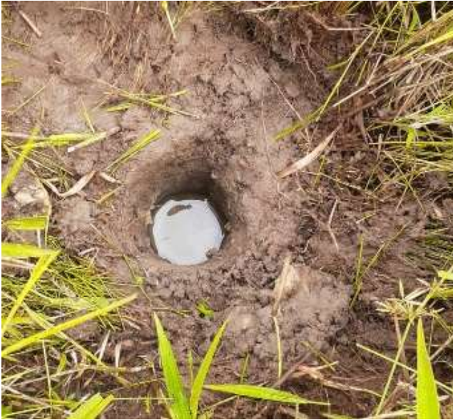
Ilustración 5 hallazgo de nivel freático.