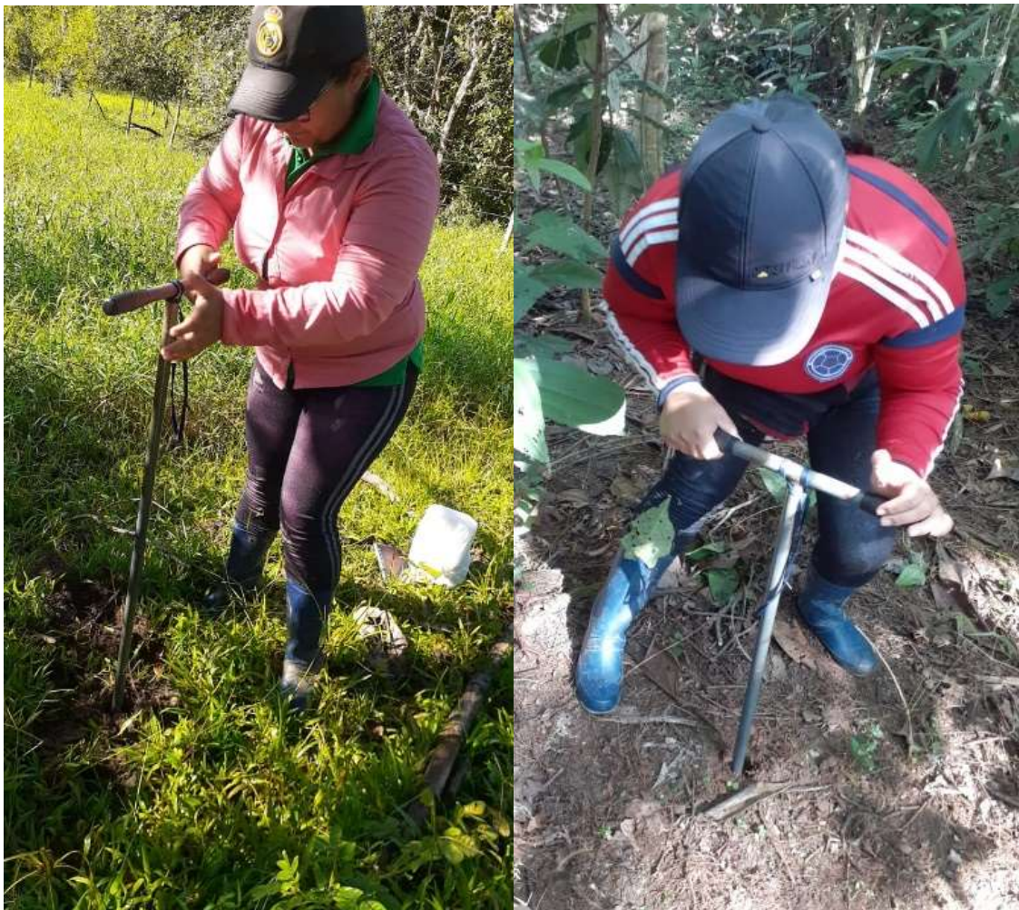
Ilustración 1 toma de muestra método barreno.