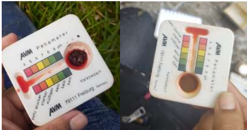
Ilustración 2 Toma de pH.