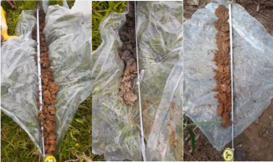
Ilustración 3 muestra de suelo para respectivos análisis.