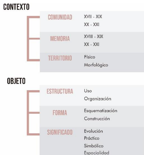
Figura 1. Valoración.

Para lograr este objetivo, se tomaron tres componentes principales: el contexto, referido a la comunidad, la memoria y el territorio; el objeto, como elemento arquitectónico, la estructura, la forma y el significado para la sociedad; y por último el sujeto, que hace énfasis al territorio socio-cultural, la cual, genera un desprendimiento de los elementos que se articulan en las relaciones físico espaciales dentro de la valoración del bien inmueble. (Ver figura 1. Valoración).