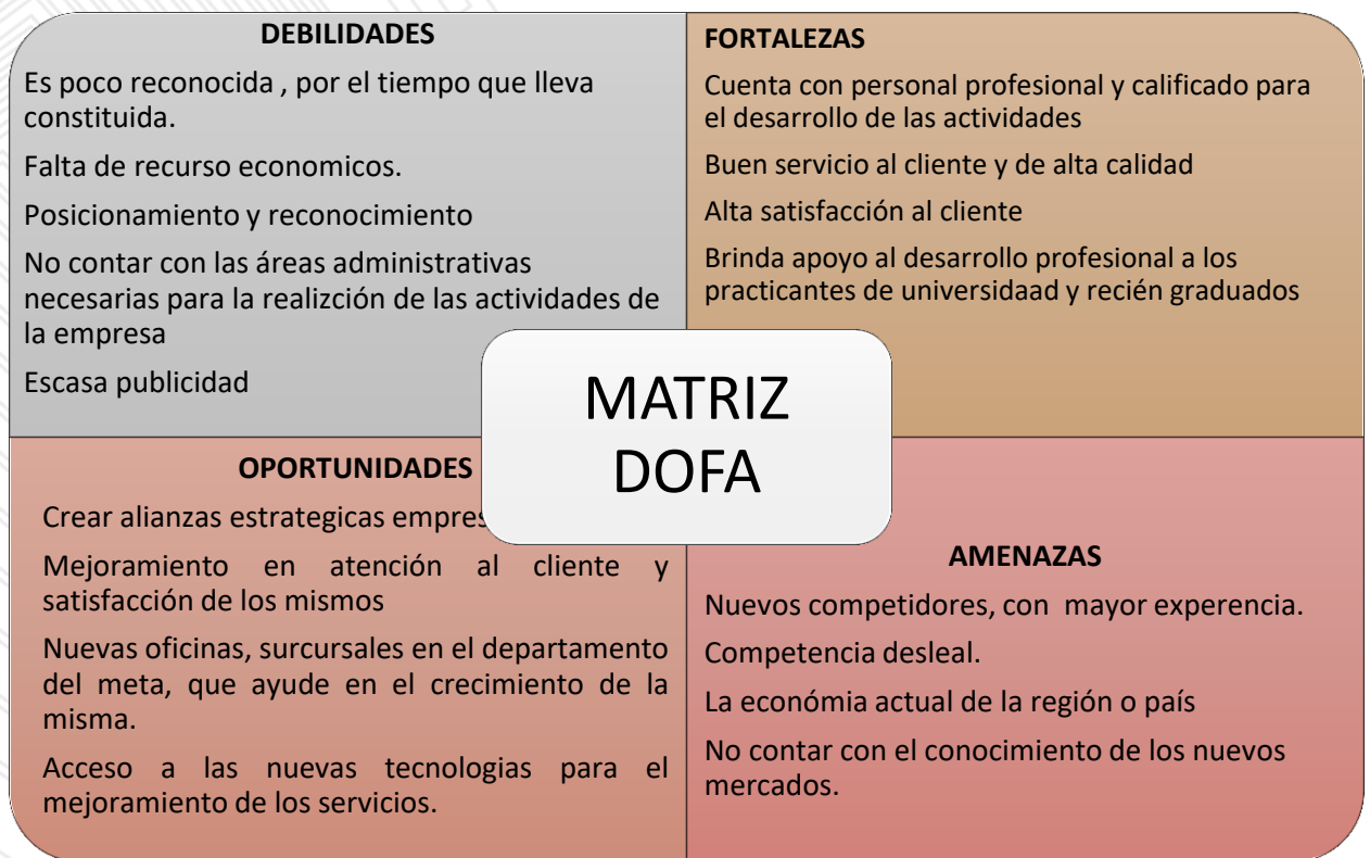
Ilustración 1 Matriz Dofa de la empresa J&P SERVICES

Para el diagnóstico se hace por medio de una matriz dofa (Ilustración 1), donde se especifica aquellas, debilidades, fortalezas, oportunidades y amenazas, que caracteriza a la empresa J&P services Group S.A.S, para luego realizar un análisis: