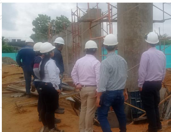
Ilustración 3 Visita a campo

Durante la etapa de prácticas se realizó un análisis inicial del presupuesto contractual del proyecto constructivo escenario de prácticas, posterior se procedió a través de visitas de campo a identificar las cantidades reales requeridas para la ejecución del proyecto, esto para finalmente identificar las empresas a nivel local y nacional que distribuyan los elementos requeridos para solicitar cotizaciones de acuerdo a los requerimientos de la entidad contratante que permitieran alimentar la modificatoria, para finalmente plasmar la información en el formato de consulta para la empresa.